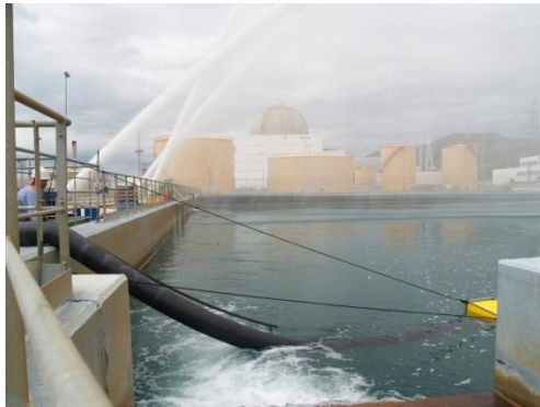
Sesiones de formación con las nuevas bombas portátiles adquiridas.

En este sentido, una de las novedades de esta parada es la creación de un espacio dentro del “Aula ANAV” de formación, situada en el Vivero de Empresas de Vandellòs i l’Hospitalet de l’Infant donde se ubica la Oficina de Recarga, en la que los profesionales podrán ensayar en un simulador muchos de los trabajos que se desarrollarán durante este período.